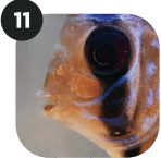
OCTOMITUS / HEXAMITA / SPIRONUCLEUS