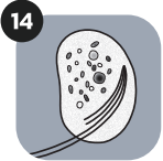
ICHTHYOBODO NECATOR (COSTIA)