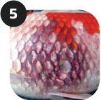
PSEUDOMONAS / AEROMONAS