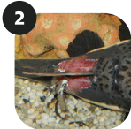
TRAUMA / FERIDAS